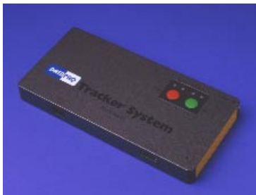
Enregistreur Datapaq II