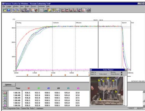
Logiciel "Temps réel" Datapaq Furnace Tracker