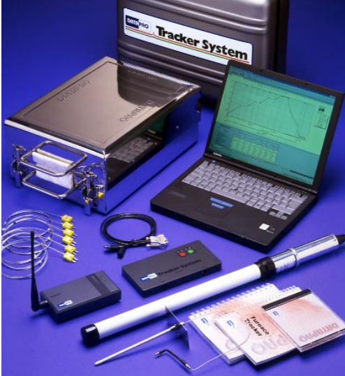
Système Datapaq à Radiotélémessure Furnace Tracker