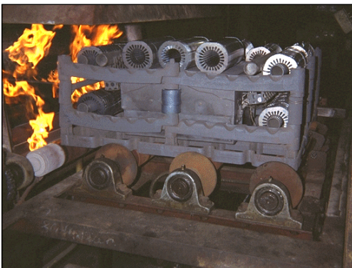
Système à Télémessure Furnace Tracker entrant dans le four

Le système Datapaq de Radio Télémessure vous permet d'observer en temps réel la température de votre produit lors de son passage dans le four de traitement thermique. Les thermocouples, connectés au produit, restituent les informations vers l'enregistreur situé à l'intérieur du four au milieu des produits. Protégé de la chaleur du four par une protection spécialement conçue par les ingénieurs de Datapaq, l'enregistreur transmet les résultats obtenus vers l'ordinateur en utilisant les fréquences radio. Pour conserver toutes les mesures, celles-ci sont sauvegardées par l'enregistreur pendant la transmission.